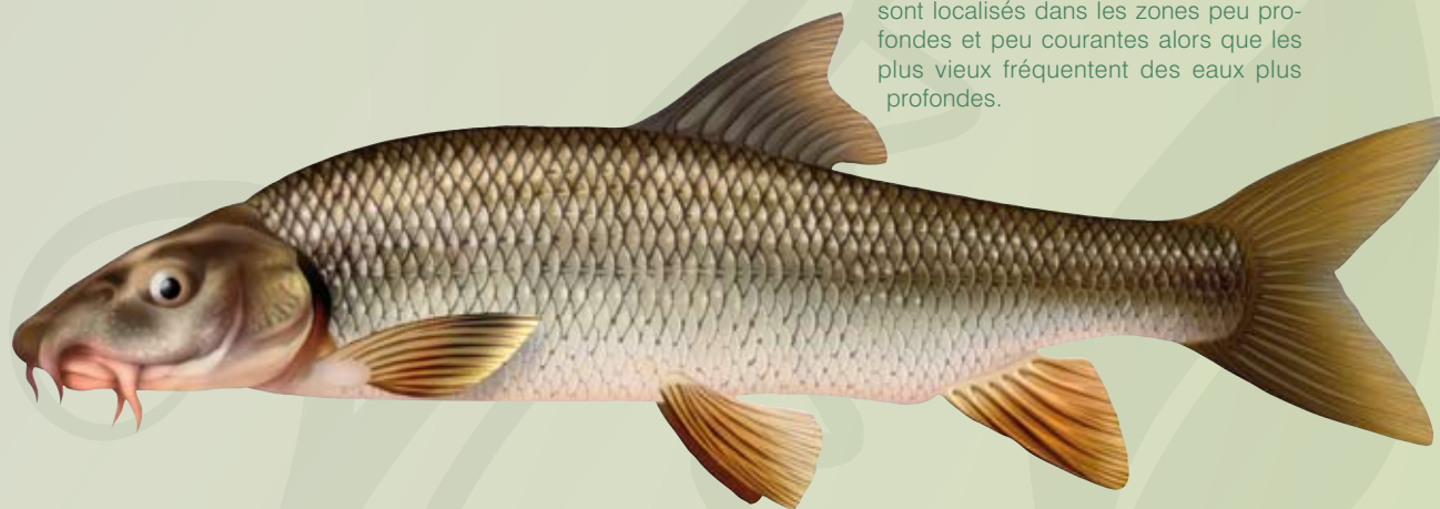
© Illustration de poisson / P.J. Dunbar

Ce poisson possède un corps allongé, cylindrique et fin. La forme de son ventre est adaptée à la vie sur le fond. Munies de deux paires de barbillons, les lèvres de sa bouche sont épaisses et charnues. Ses nageoires caudales sont de teinte orangé (sa nageoire anale et pelvienne également).