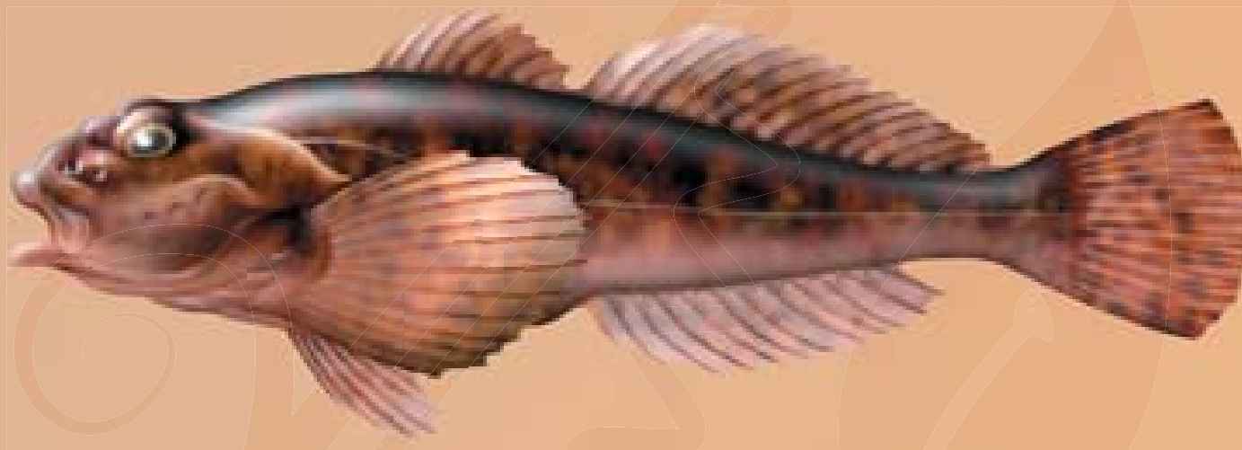
© Illustration de poisson / F.J. Dunbar

Le chabot possède un corps trapus couvert d'écailles minuscules peu apparentes (aspect de peau nue). Il est épais dans sa partie antérieure et aminci dans sa partie postérieure. La ligne latérale est bien marquée. Sa tête est caractéristique : large et aplatie. Chaque opercule est muni d'une épine. La bouche est grande avec des lèvres épaisses. Les yeux se positionnent haut sur la tête afin de pouvoir repérer les proies qui nagent au-dessus du fond.