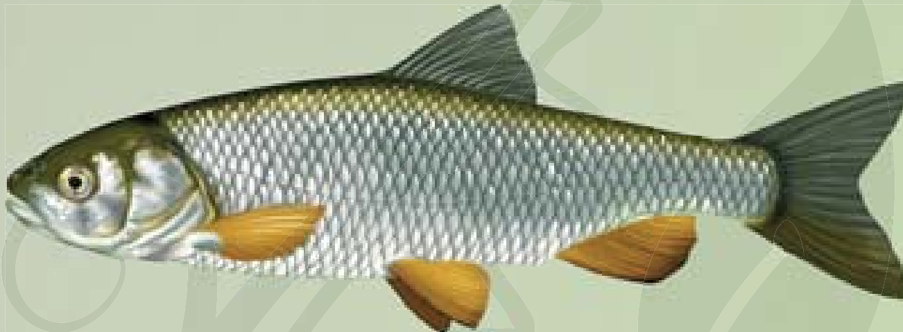
© Illustration de poisson / P.J. Dunbar

Le chevaine possède un corps cylindrique, allongé et robuste. Son dos est légèrement bombé. Ses écailles, dorées à blanchâtres, sont grandes et liserées de noir (bord foncé). Sa tête est massive, munie d'une large bouche. Sa nageoire anale présente un bord convexe.